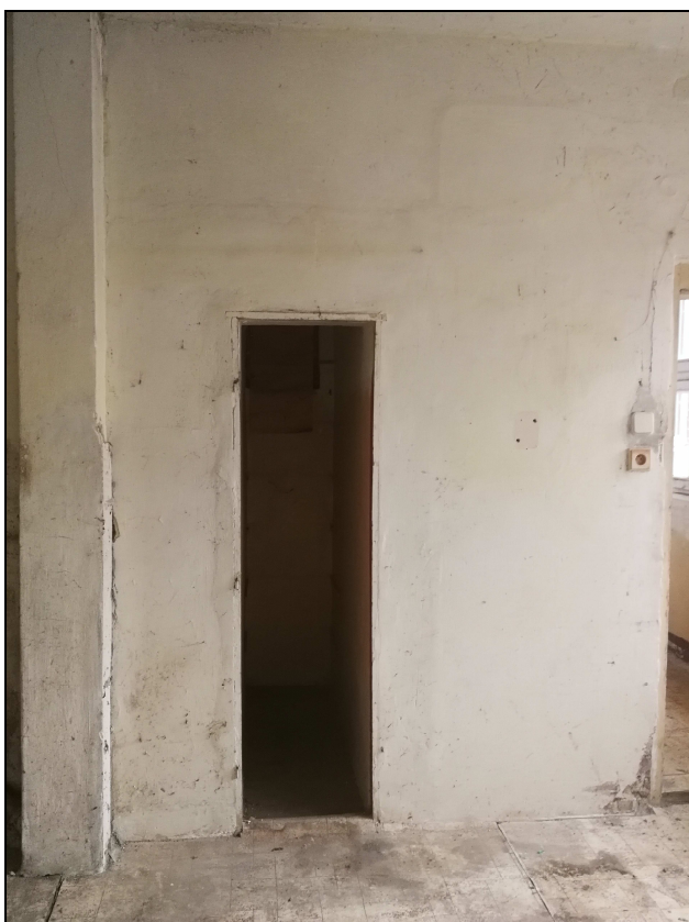
Obr. č. 14 – Kuchyně - spíž