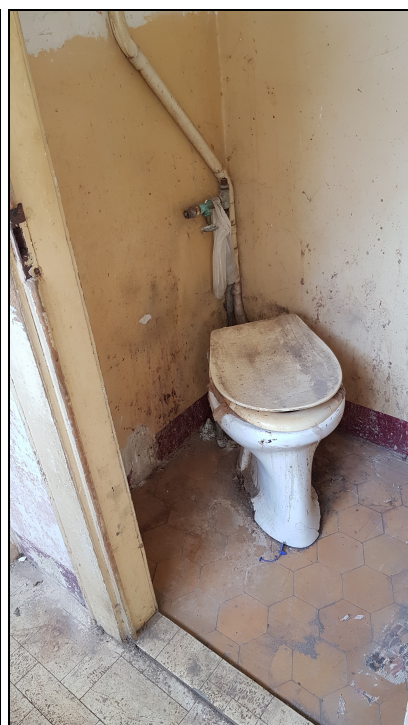
Obr č. 10 – WC