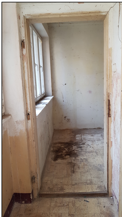
Obr č. 8 – Dveře do kuchyně