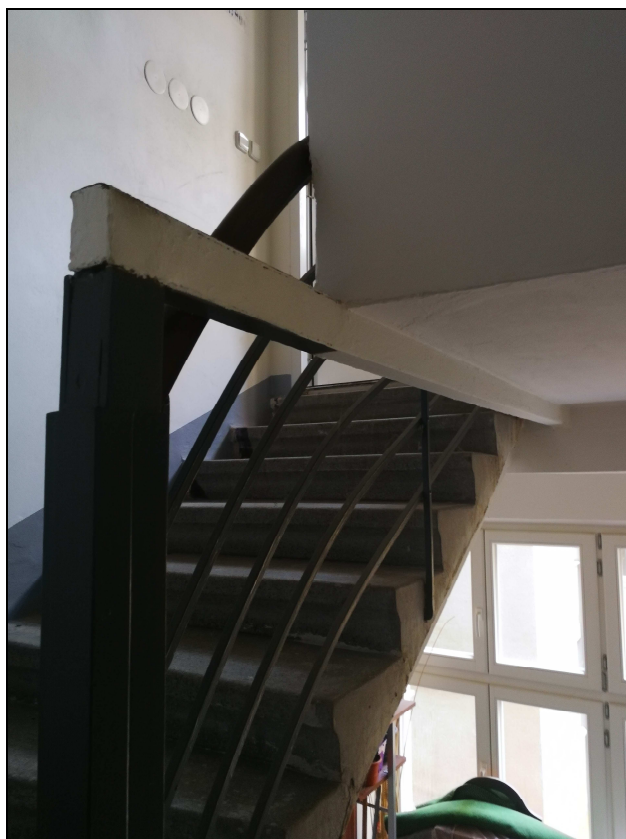
Obr. č. 2 – Domovní schodiště