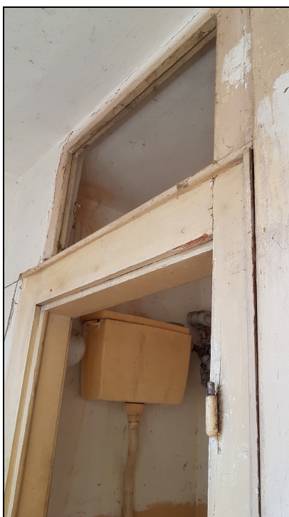
Obr č. 9 – Dveře do WC