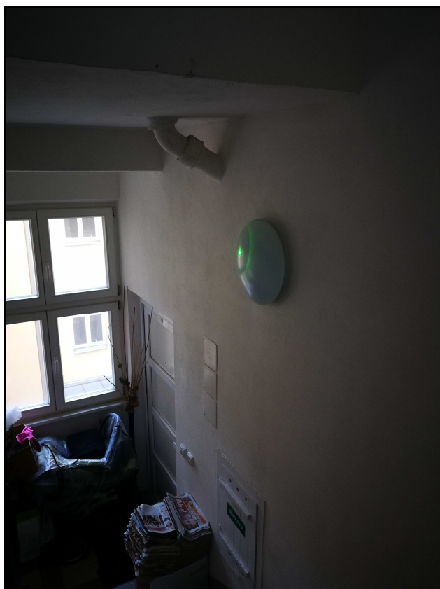
Obr. č. 3 – Odpad od WC veden v domovní chodbě