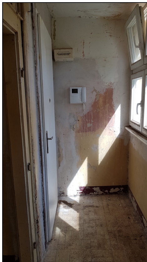
Obr č. 6 – Chodba (4.01)