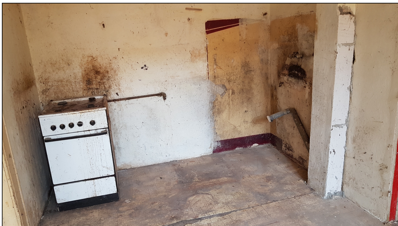
Obr č. 11 – Kuchyně (4.03)