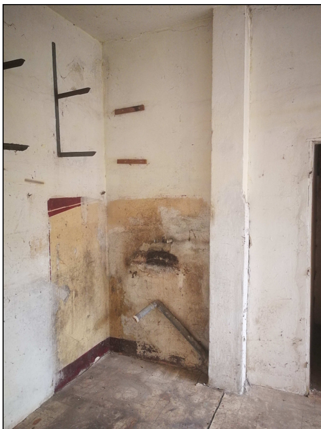
Obr. č. 13 – Kuchyně – odpad ZTI