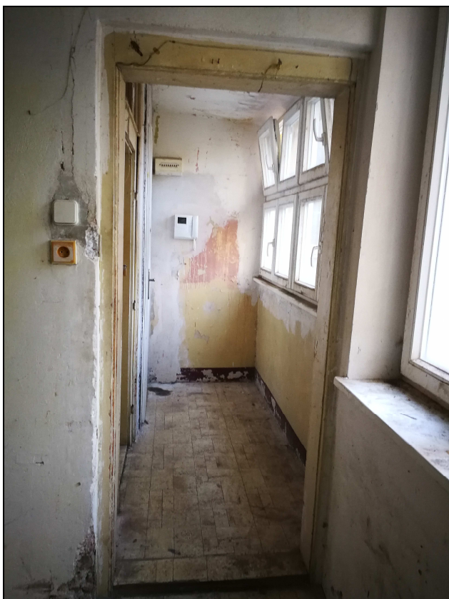
Obr č. 16 – Pohled z kuchyně do chodby