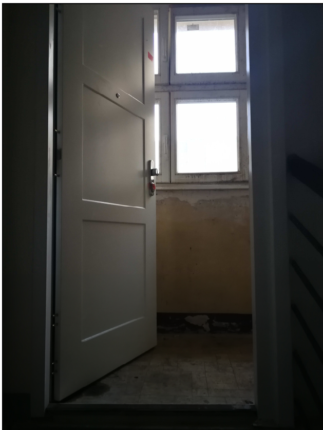
Obr č. 5 – Dveře do bytu