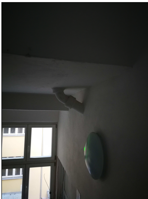
Obr. č. 4 – Odpad od WC