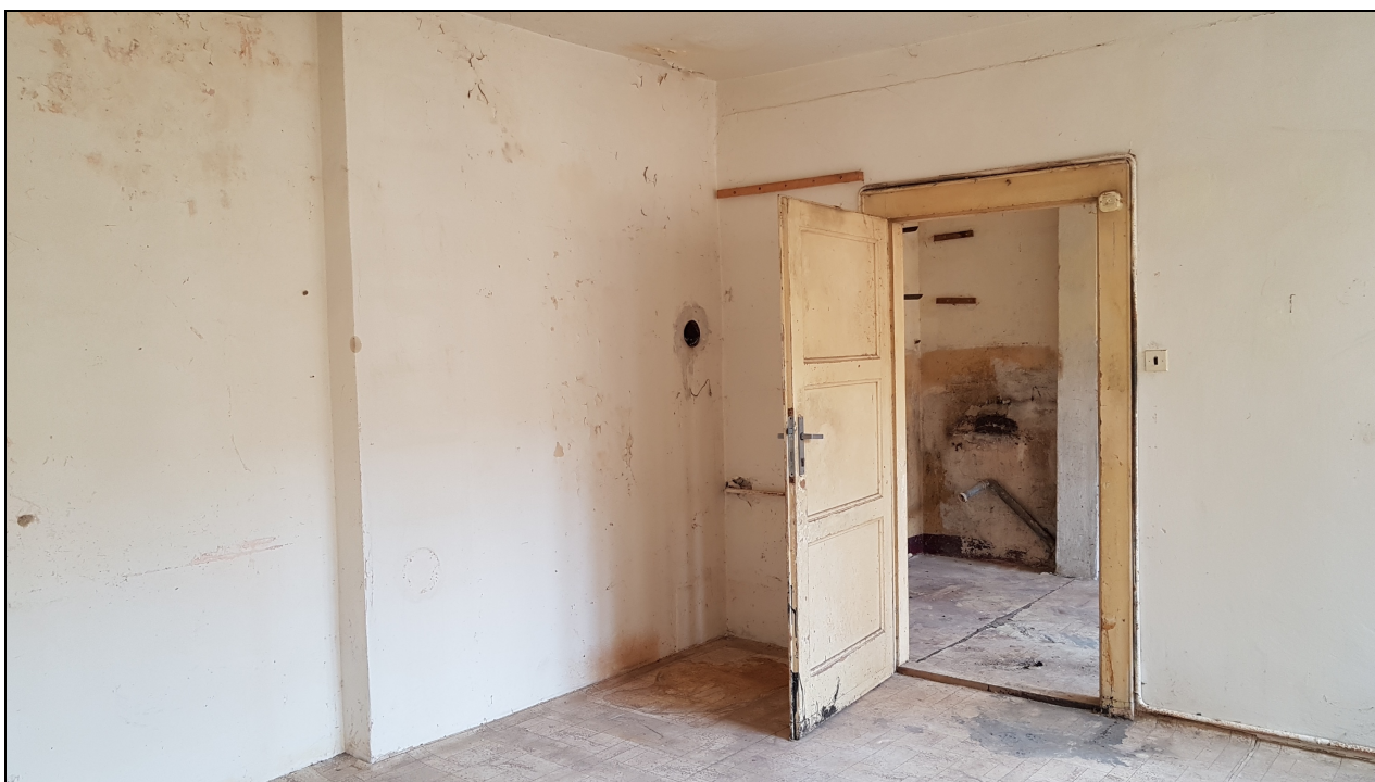
Obr č. 20 – Ložnice (4.05) - dveře