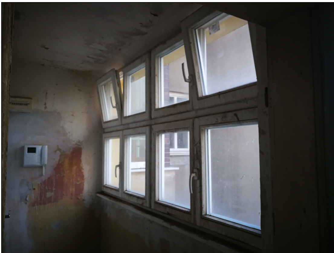
Obr č. 7 – Okenní sestava v chodbě (4.01)