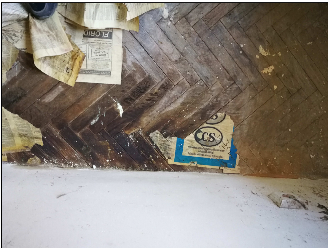
Obr. č. 21 – Poškozená podlaha v kuchyni