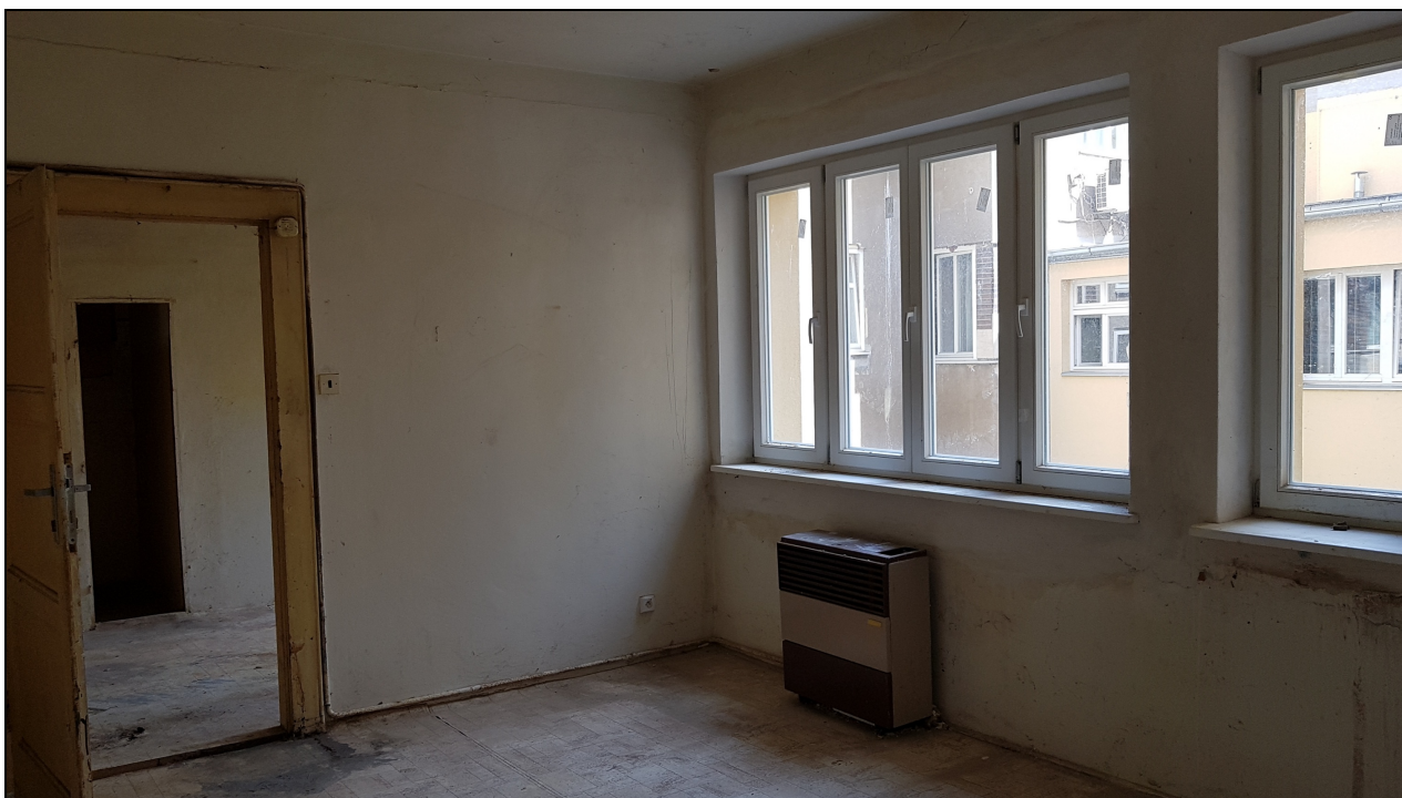
Obr č. 19 – Ložnice (4.05) – okna + topidlo