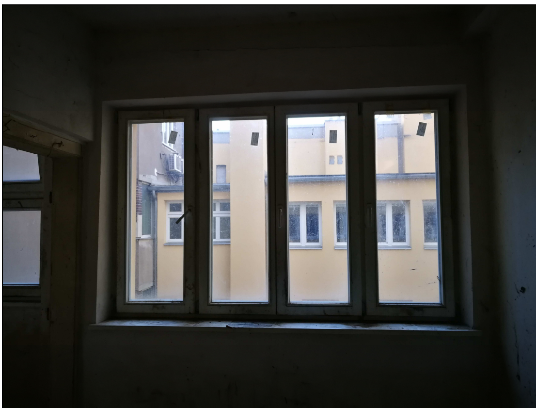
Obr č. 18 – Kuchyně - okna