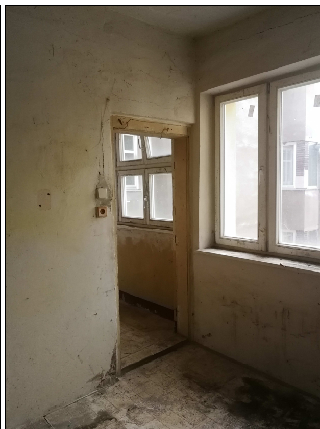
Obr. č. 15 – Kuchyně - vstup