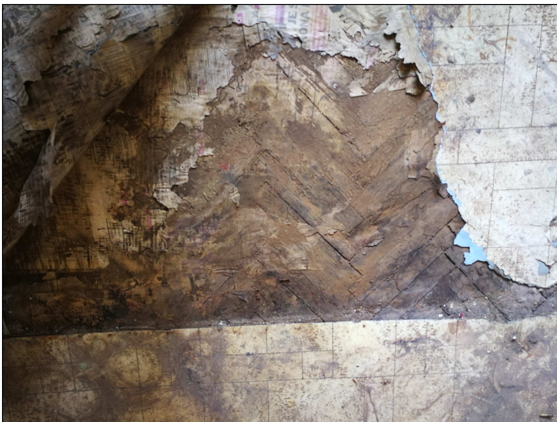
Obr. č. 22 – Poškozená podlaha v kuchyni