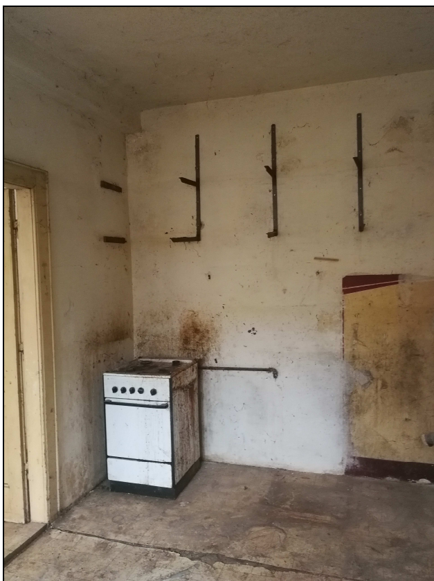
Obr. č. 12 – Kuchyně - sporák