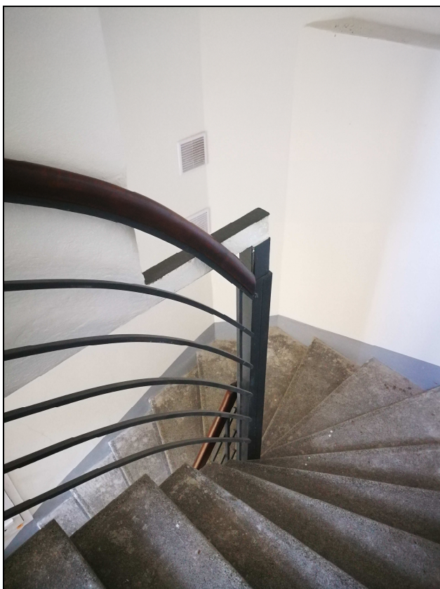
Obr. č. 1 – Domovní schodiště