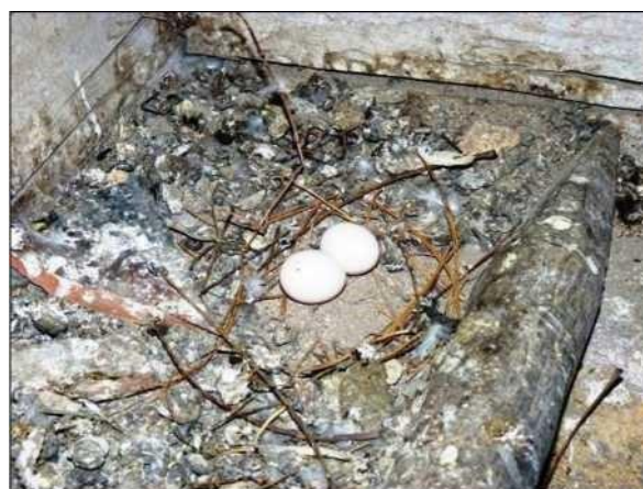
Hnízdo holuba věžáka je většinou nedokončené