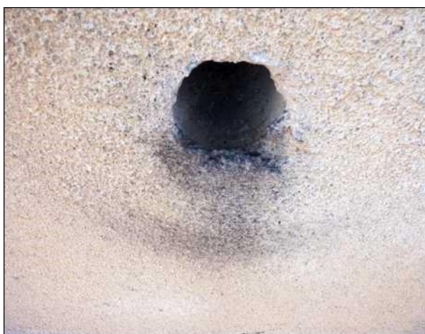
Znečištění fasády pod ventilačním otvorem způsobené otěrem rýdovacích per pěvců