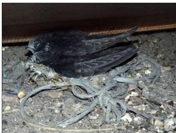
Rorýsi často hnízdo nestaví, spokojí se s materiálem, který v dutině naleznou