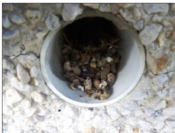
Trus drobných pěvců v ústí ventilačního otvoru