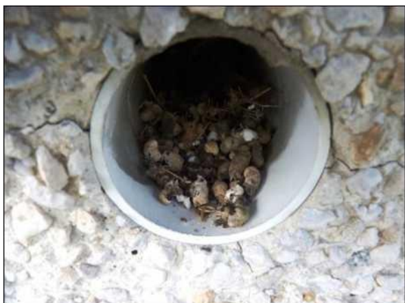
Trus rorýse obecného v ústí ventilačního otvoru