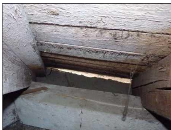
Prostor za pozednicí nejčastější hnízdiště synantropních ptáků