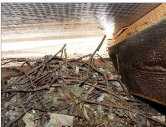
Hnízdo kavky se skládá z hrubšího materiálu, převážně větvíček dřevin rostoucích v okolí