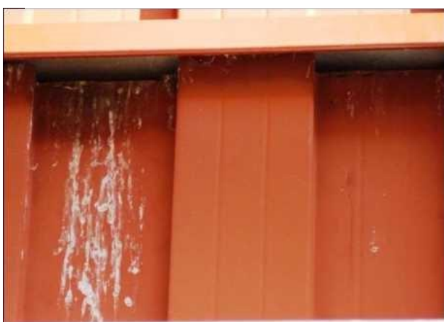
Prostor pod vletovým otvorem pěvců je často znečištěn trusem