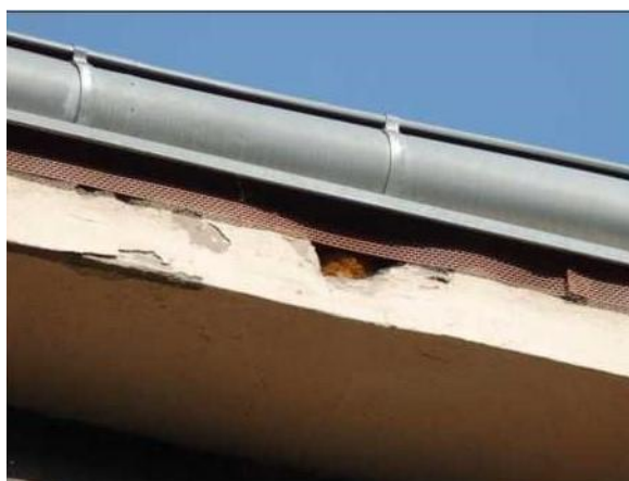
Detail poškození římsy – vletový otvor do hnízda