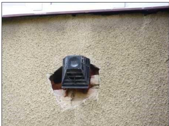
Nezačištěné okraje odvětrání podokenního hnízdiště rorýse obecného