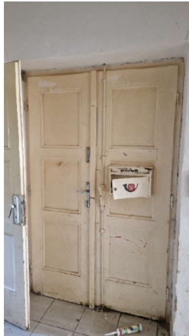
Vstupní dveře z bytu