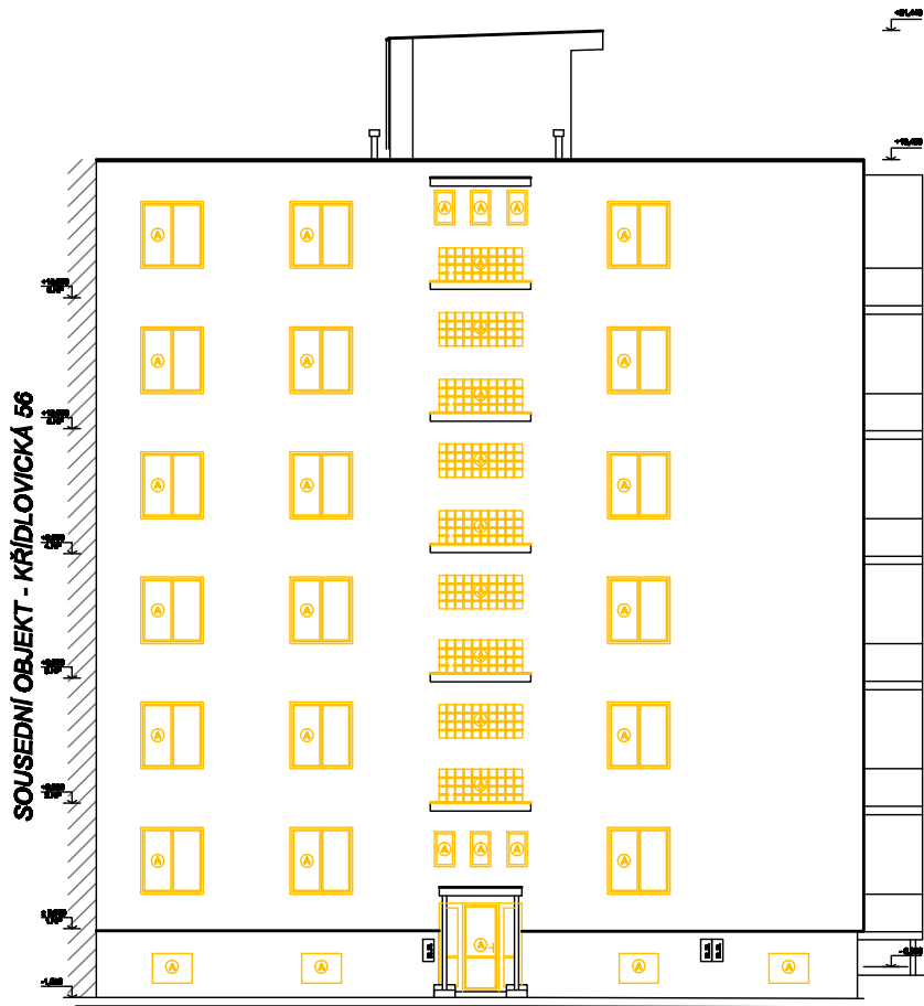
POHLED Z UL. KŘÍDLOVICKÁ