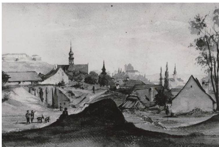
Prostor nad starobrněnským klášteřem, v úpatí Žlutého kopce, 19. století.