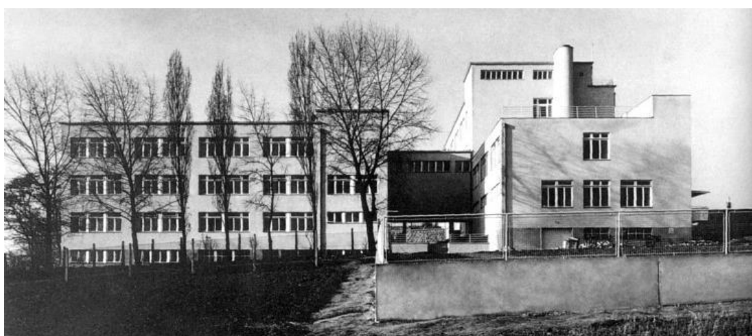
Masarykův onkologický ústav