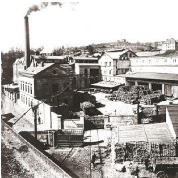
Pivovar Starobrno r. 1872