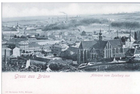
Celkový pohled na prostor Mendlova náměstí ze Špilberku, počátek 20. století