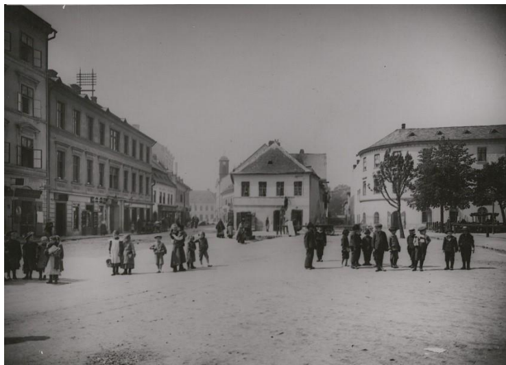
Prostor dnešního Mendlova náměstí a ul. Křížové, v pozadí se starobrněnskou radnicí, počátek 20. stol.