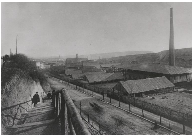
Ulice Úvoz ze Špilberku s objekty někdejších cihelen, počátek 20. století.