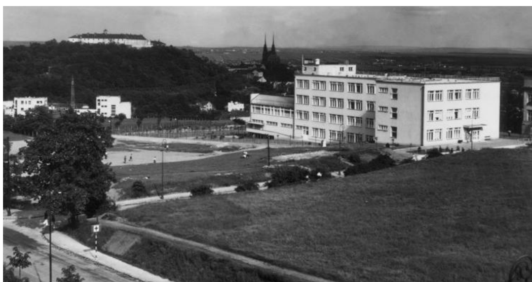
Masarykův onkologický ústav