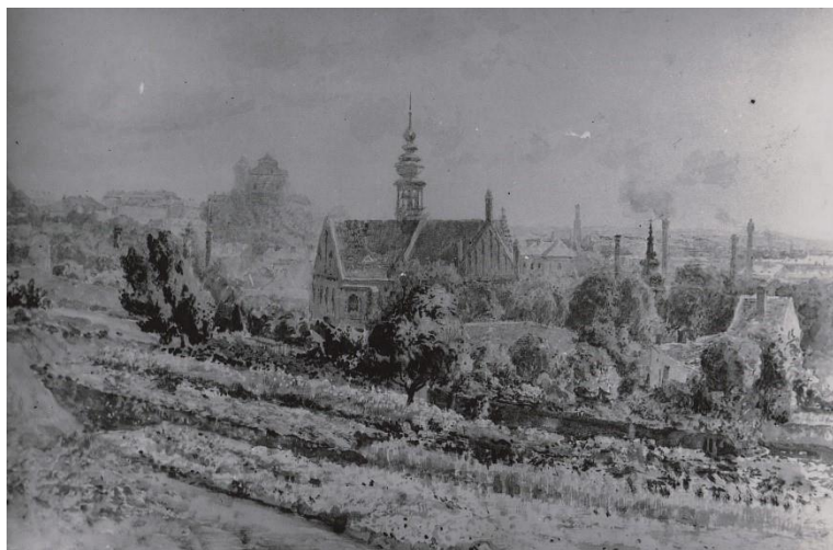
Prostor nad starobrněnským klášterem, v úpatí Žlutého kopce, 19. století.