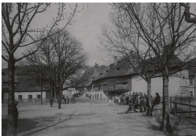
Prostor dnešního Mendlova náměstí, počátek 20. století.