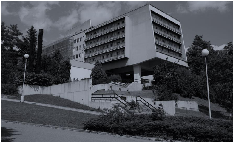
Národní centrum ošetrovatelství a nelékařských zdravotních odborů v Brně