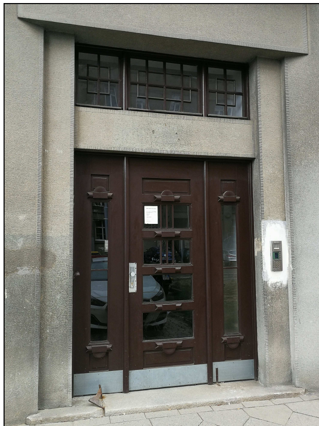
Obr. č. 2 – Vstupní dveře