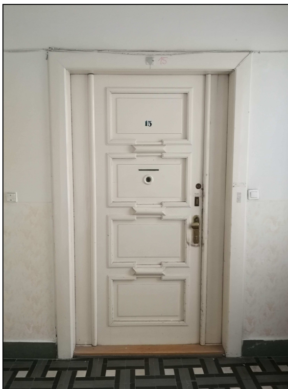
Obr č. 6 – Vstupní dveře do bytu