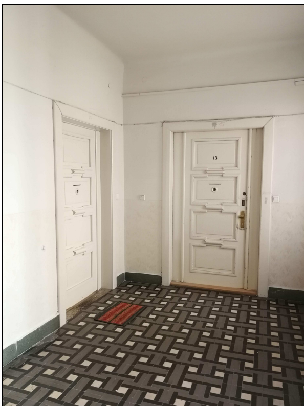
Obr č. 5 – Domovní chodba – vstupní dveře do bytu