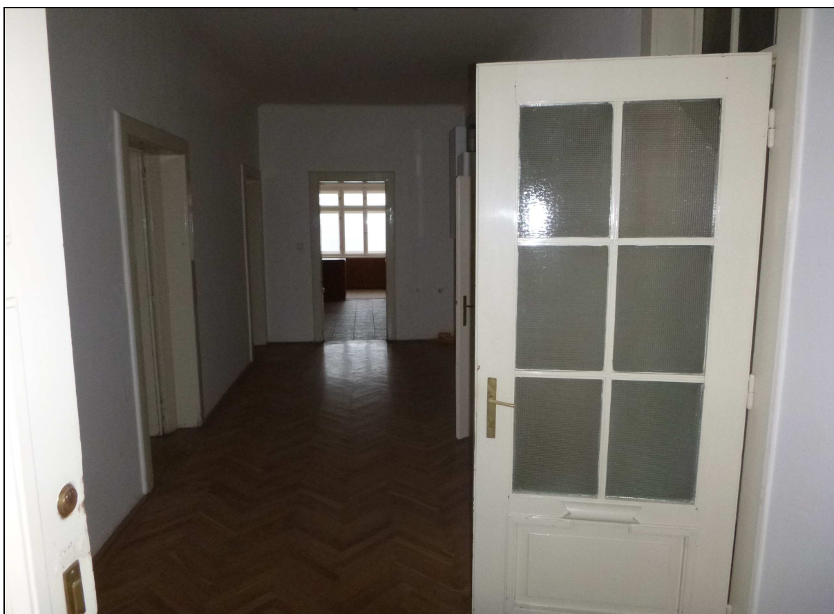
Obr č. 7 – Chodba (1.01)