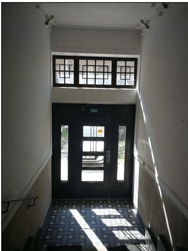
Obr. č. 3 – Vstupní chodba 1