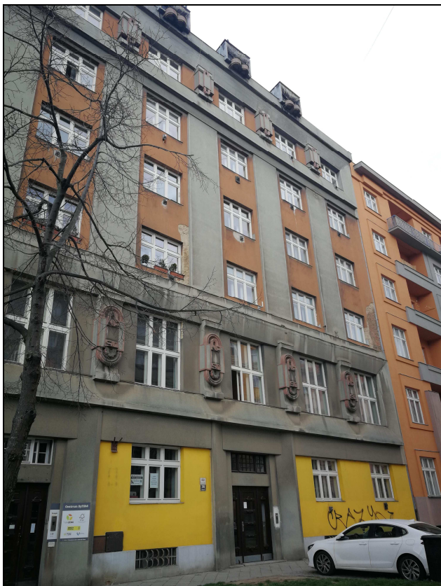
Obr. č. 1 – Fasáda domu z ulice Kounicové