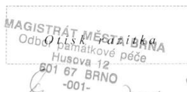
Ing. arch. Martin Zedníček vedoucí Odboru památkové péče MMB

Toto závazné stanovisko OPP MMB je ve smyslu §149 odst. 1 zákona č. 500/2004 Sb., správní řád, úkonem, který není samostatným rozhodnutím ve správním řízení a jehož obsah je závazný pro výrokovou část rozhodnutí příslušného stavebního úřadu. Nejedná se o samostatné správní rozhodnutí a proto se proti němu nelze odvolat. Námitky je možné uplatnit prostřednictvím odvolání proti rozhodnutí příslušného stavebního úřadu v této věci.