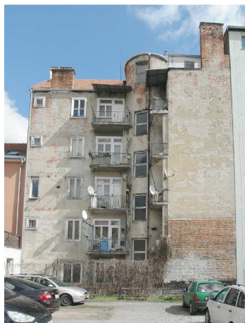
Pohled na dvorní fasády z parkoviště