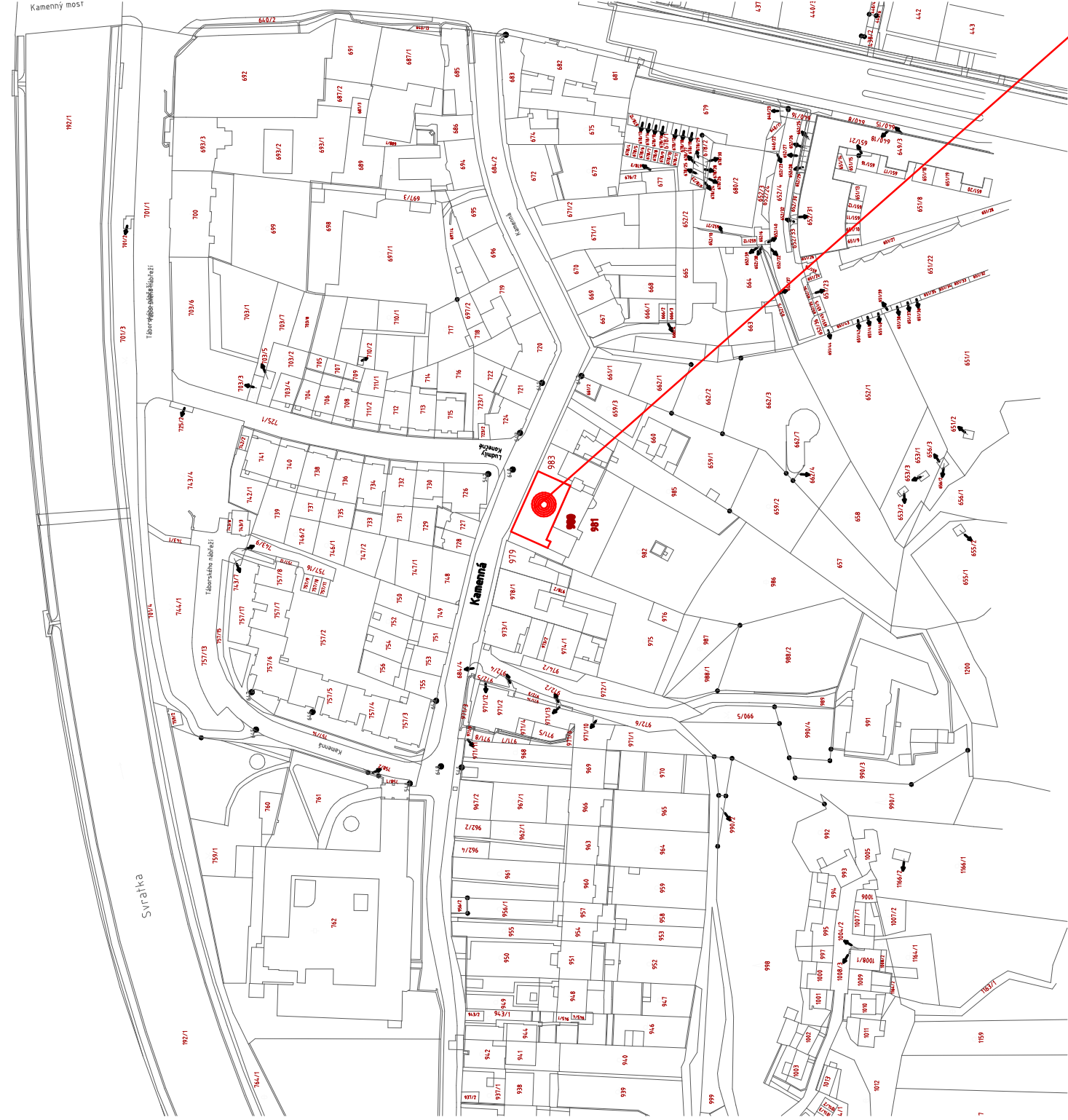
OBJEKT MŠ KAMENNÁ 21 MÍSTO STAVBY