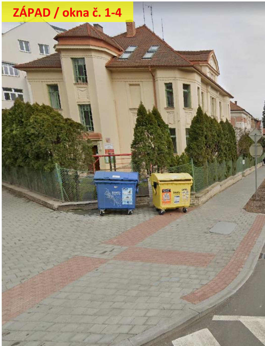
ZÁPAD / okna č. 1-4