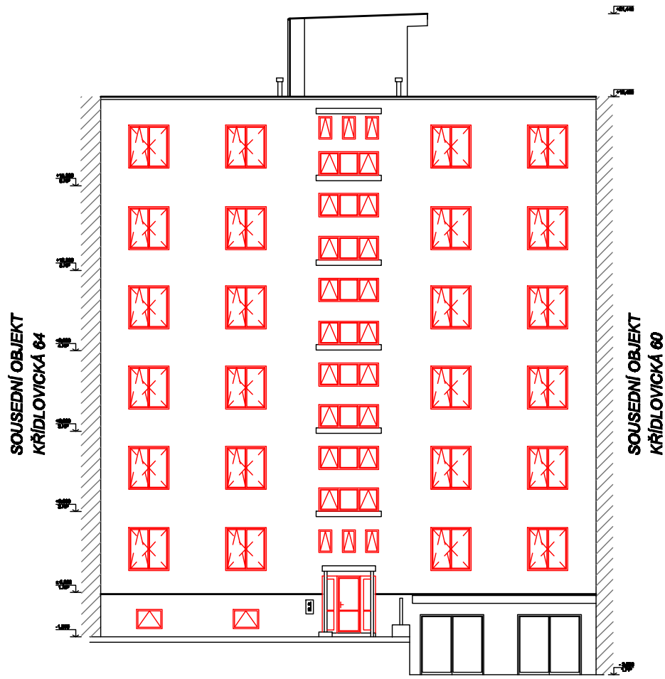
POHLED Z UL. KŘÍDLOVICKÁ